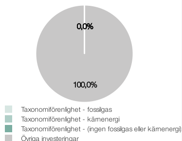
1. Taxonomiförenlighet hos investeringar, inklusive statliga obligationer*